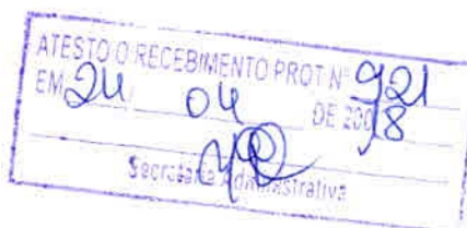
Albério Faustino Farias - Vereador -

Sala das Sessões, em 23 de abril de 2018