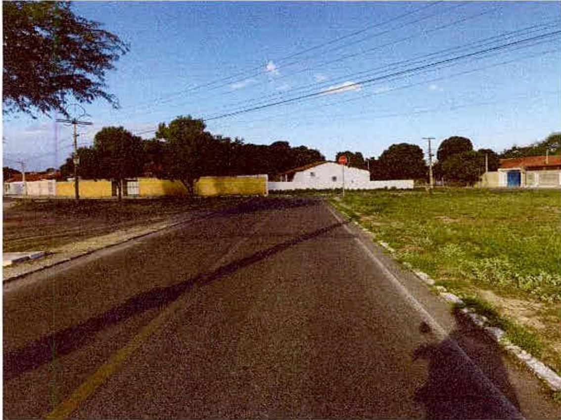
ENTRADA DO BAIRRO VILA NOBRE