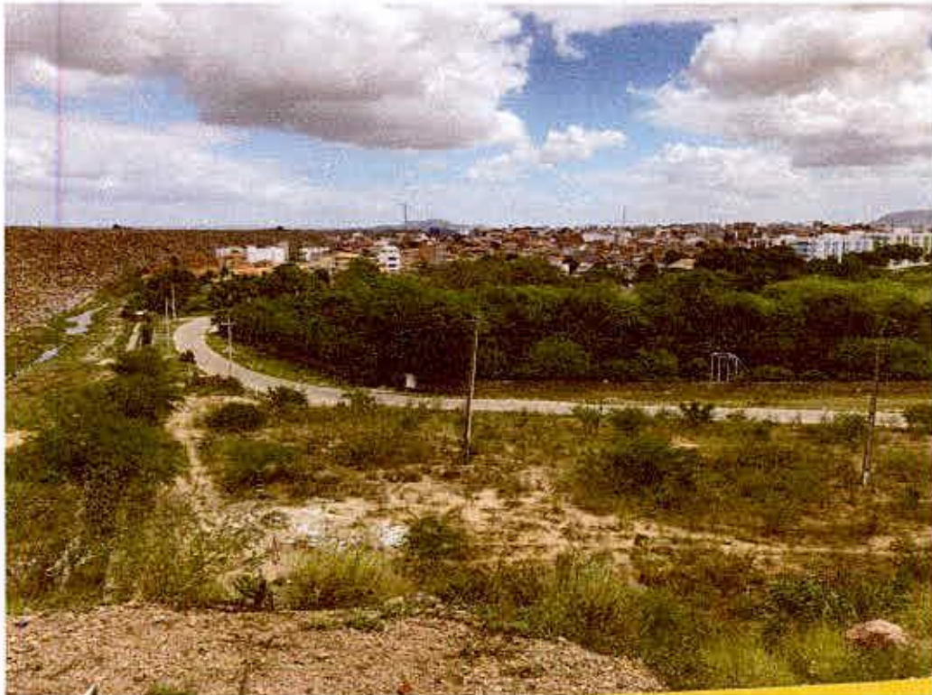
AV. DO GRANDE HOTEL POR TRÁS DO QUARTEL.