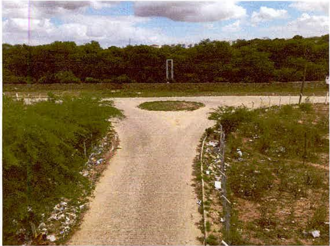
AV. DO GRANDE HOTEL