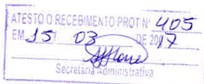
Albério Faustino Farias - Vereador -

Sala das Sessões, em 15 de março de 2017