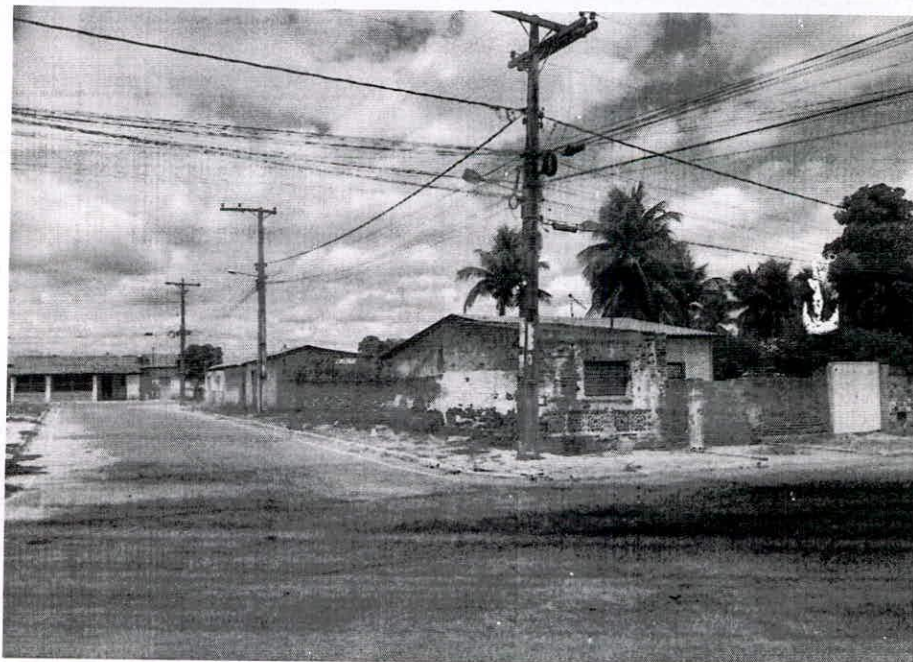
Anexo I – Local atual em que os moradores aguardam o transporte coletivo.