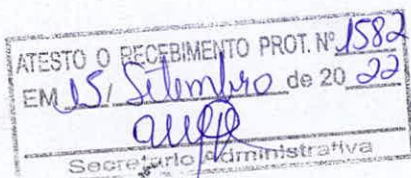
Albério Faustino Farias - Vereador -

Sala das Sessões, em 14 de setembro de 2022