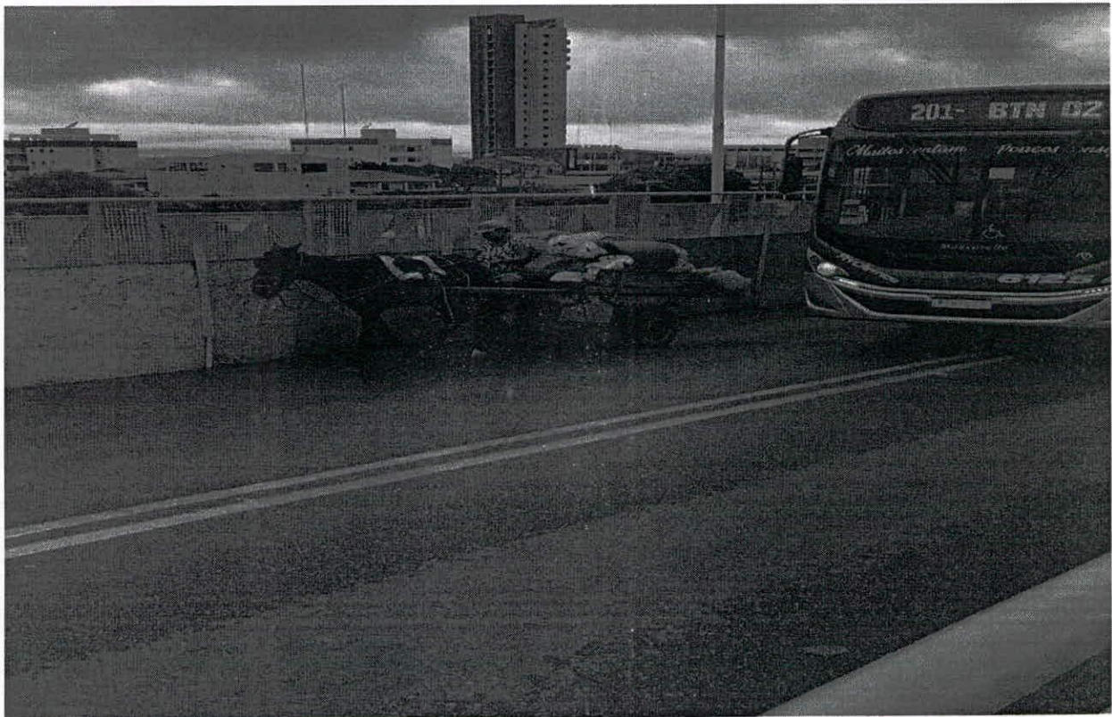
CARROÇAS, ÔNIBUS, CARROS TRAFEGAM NA MESMA VIA