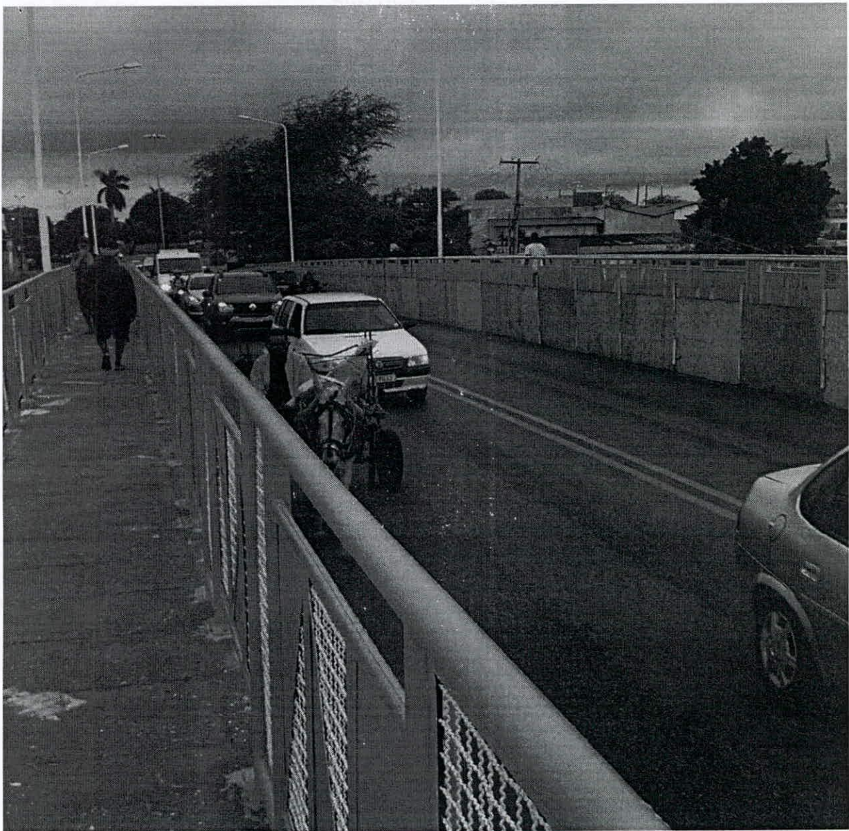
CARROÇAS, ÔNIBUS, CARROS TRAFEGAM NA MESMA VIA