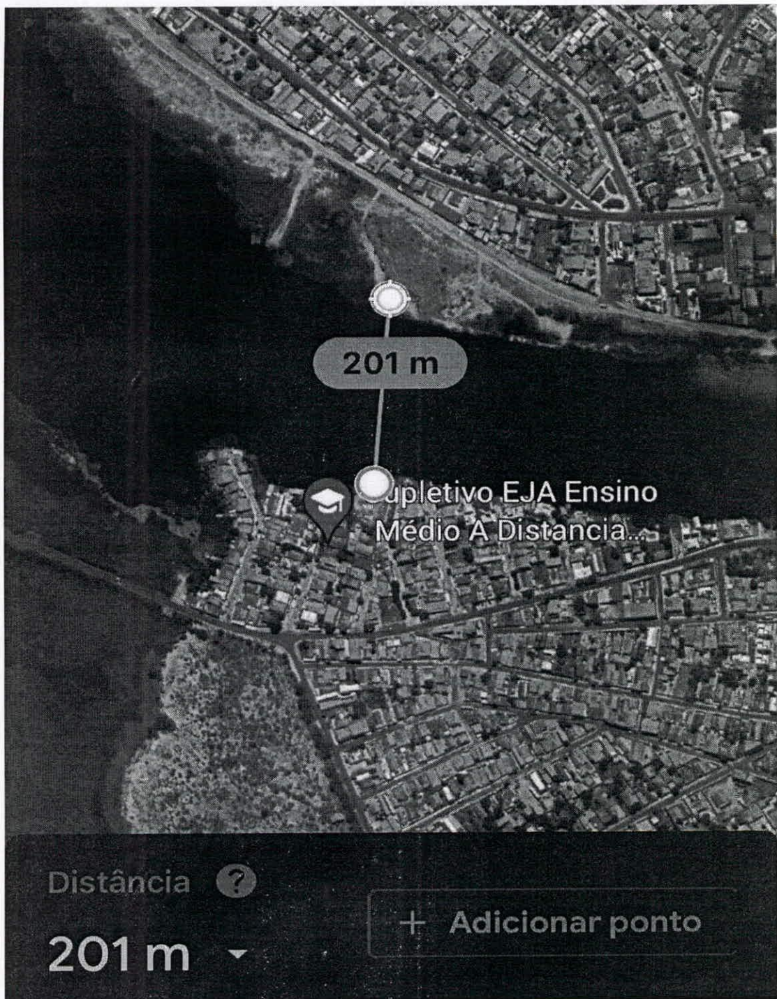
DISTANCIA BAIRRO JARDIM BAHIA X PANORAMA