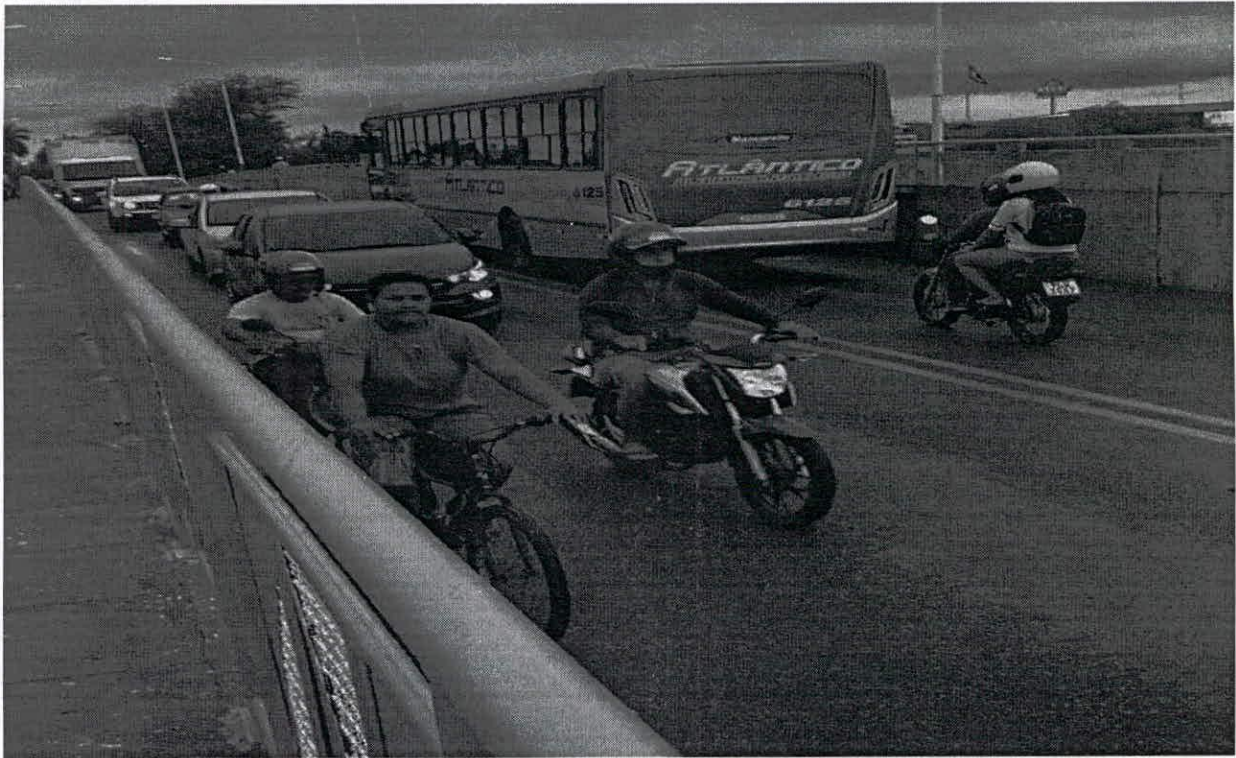
BICICLETAS, CARROS E MOTOS TRAFEGAM NA MESMA VIA