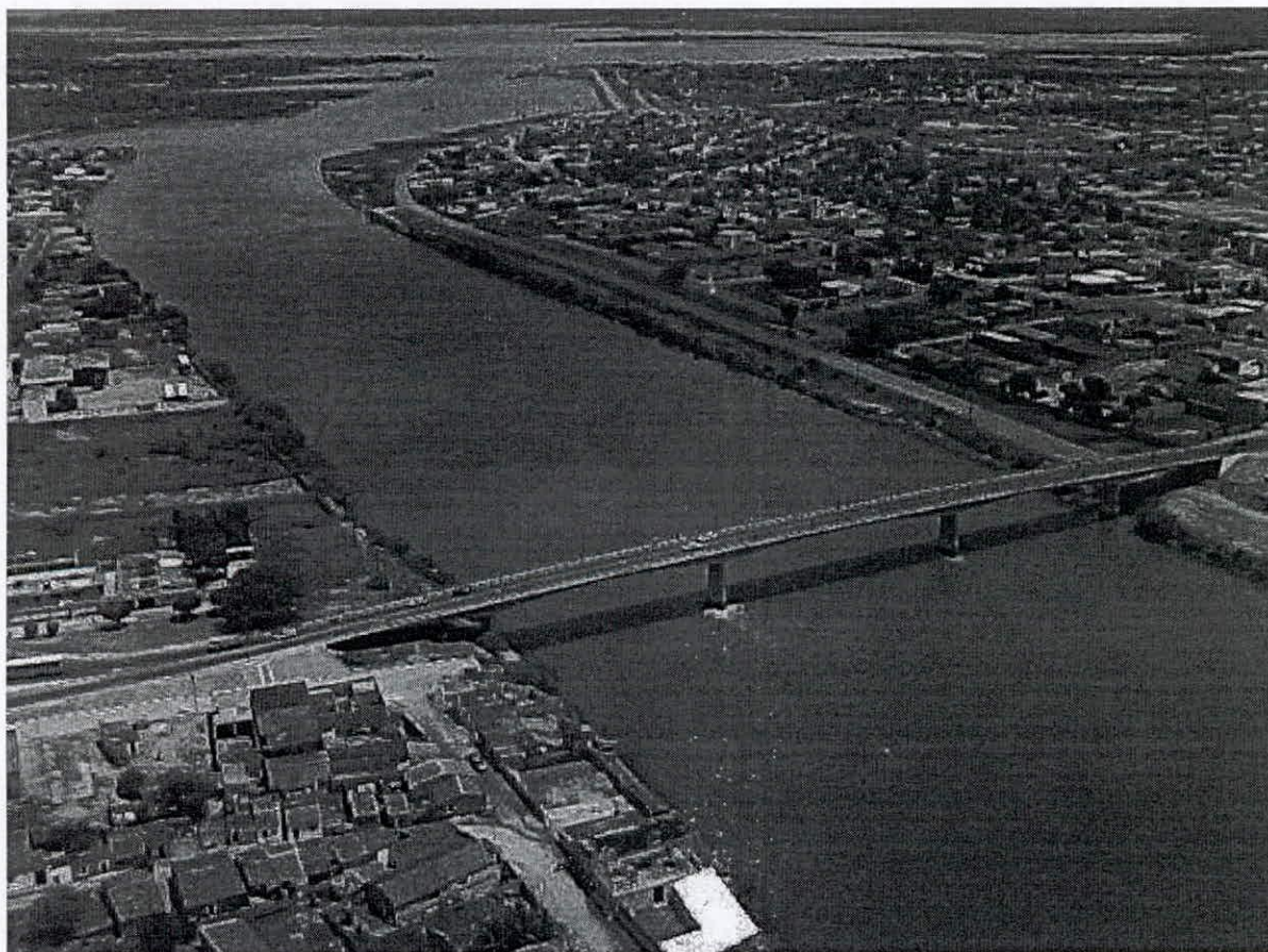
ÚNICA PONTE DE ACESSO A ILHA DE PAULO AFONSO

Destarte, uma nova ponte de acesso à ilha trará um grande benefício para toda cidade no exspecto de infraestrutura, trará a expansão da cidade no sentido desta nova ponte e será uma benfeitoria essencial de extremo apreço para toda a população.