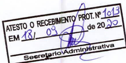
Lourival Moreira dos Santos - Vereador -

Sala das Sessões, em 15 de setembro de 2020