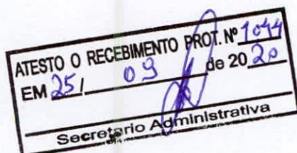
Lourival Moreira dos Santos - Vereador -

Sala das Sessões, em 24 de setembro de 2020.