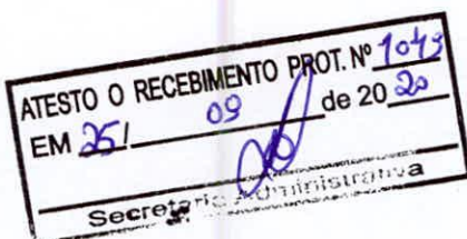
Lourival Moreira dos Santos - Vereador -

Sala das Sessões, em 25 de setembro de 2020.