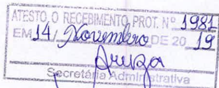
Lourival Moreira dos Santos - Vereador -

Sala das Sessões em 13 de novembro de 2019.