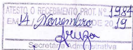
Lourival Moreira dos Santos - Vereador -

Sala das Sessões em 13 de novembro de 2019.